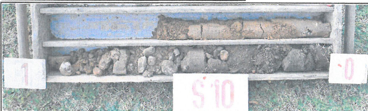
Obr.č. 20: Pohled na geologický profil sondy S10 , hluboké 1,6 m. Pod vegetačním humózním horizontem tl. 0,2 m zastižena písčítá hlína , drobná, drobně štěrkovitá. V hloubce 0,5 m dokumentován hlinitý písek velmi ulehlý , hrubě štěrkovitý, od 0,8 m jíl písčítý, pevný , drobně štěrkovitý. Od úrovně 1,2 m přechod do hnědorezavého slabě hlinitého písku, ulehlého. Podzemní voda se v sondě neprojevila.