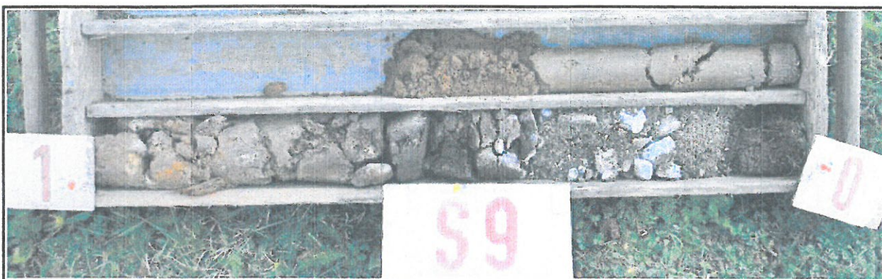
Obr.č. 18: Pohled na geologický profil sondy S9 , hluboké 1,5 m. Svrchní část tvoří zpevňující lomová štěrkokodř 0-32 mocnosti 400 mm zarostlá drnovým krytem , založená do reliktní písčité hlíny . Od hloubky 0,6 m zastižen hlinitý písek , od 0,8 m jíl písčítý se štěrkem , pevné konzistence. Od 1,4 m přechod do hnědorezavého písku, ulehlého. Podzemní voda v sondě nezastižena.