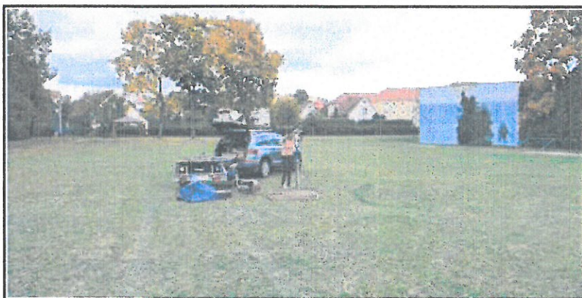
Obr.č. 19 : Pohled na střední část plochy fotbalového hřiště s místem hloubené sondy S10 .